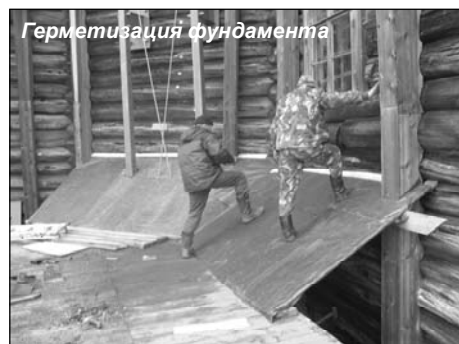
Герметизация фундамента. Реставрация полов проходила по современной методике: специальной мойкой высоко-

В сезоне 2008 г. отреставрированы плахи исторического пола XVIII века из алтаря Преображенской церкви. Приступили к реставрации полов центральной части храма.