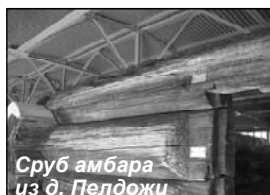
Сруб амбара из д. Пелдожи

вень. Так как государство создало нам особые условия для работы, мы и трудиться должны по-другому, — отметил зам. директора музея.