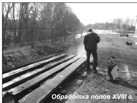
Обработка полов XVIII в.

го давления плахи мыли, вырезали дефекты и восстанавливали «больные» места аутентичными материалами с применением современных клеевых композиций.