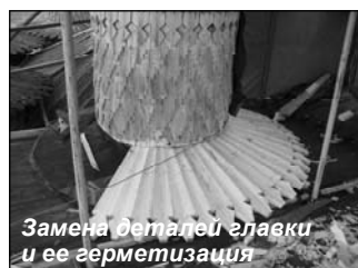
Замена деталей главки и ее герметизация

В настоящее время музей-заповедник «Кижь» — известный во всем мире музей крестьянской культуры Русского Севера. Собранная в музее коллекция памятников архитектуры насчитывает 82 постройки, самая старая из которых относится к XIV веку, основная часть — к XVIII-XIX вв. Жемчужиной коллекции является Кижский архитектурный ансамбль — объект Всемирного культурного и природного наследия ЮНЕСКО, требующий к себе особо пристального внимания.