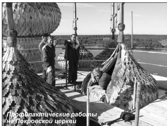
Профилактические работы на Покровской церкви

Эту новость распространили все информационные агентства страны. Председатель Правительства РФ В. Путин утвердил план мероприятий по сохранению ансамбля Кижского погоста и развитию инфраструктуры музея-заповедника «Кижь». Это, безусловно, станет началом нового этапа в развитии всемирно известного музея-заповедника и реставрации его памятников — Преображенской и Покровской церквей, колокольни, крестьянских домов и строительства так необходимых музею грузового причала и современной входной зоны. Все работы должны быть профинансированы из федерального бюджета.