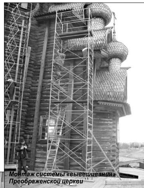
Монтаж системы «вывешивания» Преображенской церкви