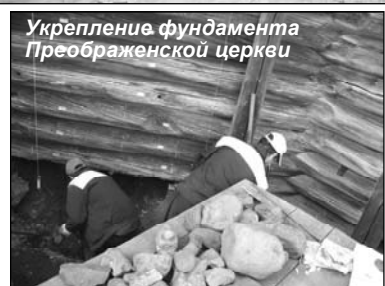
Укрепление фундамента Преображенской церкви