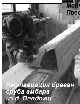
Реставрация бревен сруба амбара из д. Пелдожи