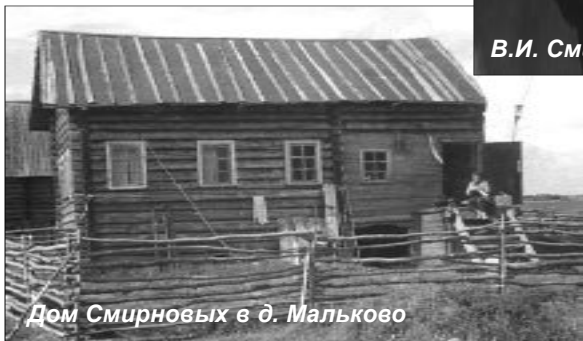
Дом Смирновых в д. Мальково

В музее того времени дисциплина была строгая. В городе рабочий день начинался с 9 утра. Сотрудники, уходя в архив или библиотеку, должны были отмечаться в специальной книге. Опоздания не одобрялись. На острове еще более жесткую дисциплину создавали туристические суды. Сотрудники музея, которых в то время было мало, проводили в день по несколько экскурсий. Группы иногда были и по сто человек, приходилось, чтобы показать туристам внутреннее убранство дома,