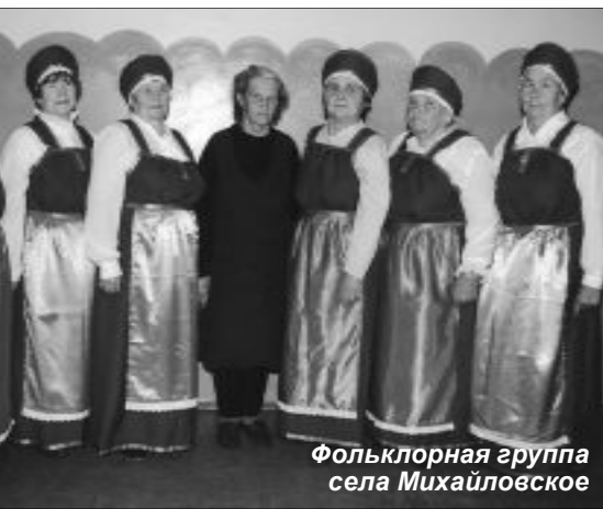
Фольклорная группа села Михайловское

В первый день, приехав в Олонец, мы смотрели и фотографировали фонды и экспозиции музея истории карелов. Во второй день были уже в самом Михайловском и заезжали в деревню Палнаволоку, где все друг другу родня. На третий день прощались с Михайловским и уезжали в Петрозаводск. Все поездки были по проселочным дорогам, не дорогам даже, а по вечно мокрому от дождей песчаным просекам в сплошном лесу. И всюду нас сопровождали красивые виды карельской природы.