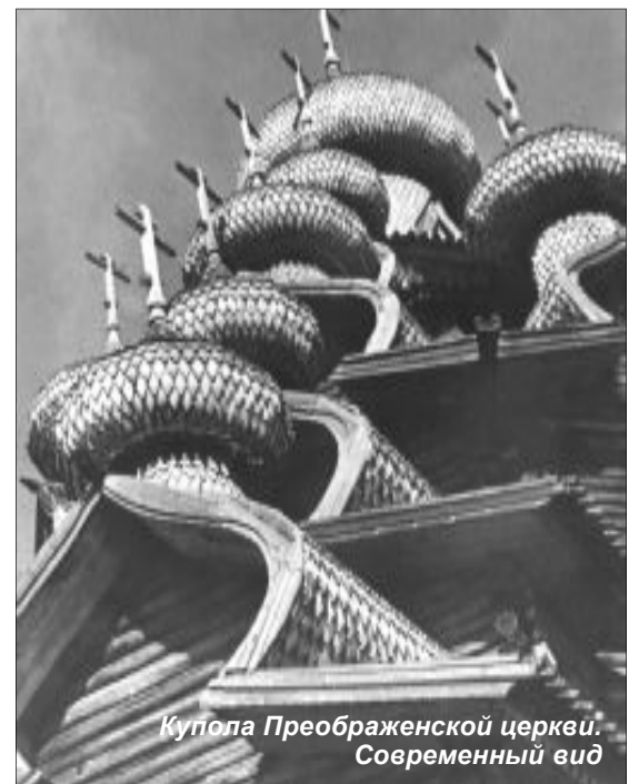
Купола Преображенской церкви. Современный вид

Знакомясь со значением термина "обложить" по "Словарю современного литературного русского языка", находим новое его понятие: "покрыть чем-либо", что уже значительно ближе к объяснению нашего термина — "облыкисей".