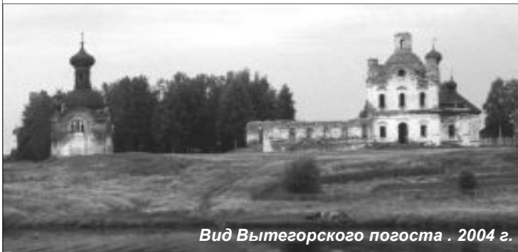
Вид Вытегорского погоста . 2004 г.

Красота может возродить себя! Это доказано на примере церкви в Анхимове.