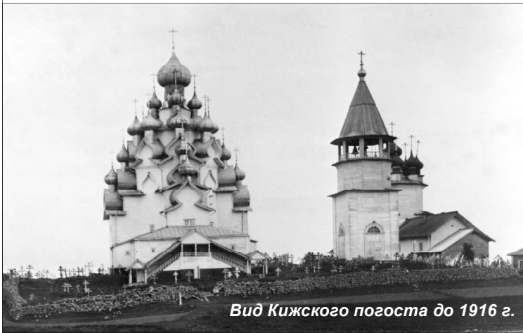
Вид Кижского погоста до 1916 г.

Стояли когда-то на противоположных бережьях Онежского бассейна две церкви-красавицы.