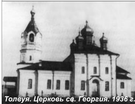
Толвуя. Церковь св. Георгия. 1936 г.

Толвуя — один из самых древних заонежских погостов. Он расположен на Карнаволоке, делящем Толвуйскую Губу на две части. Первое упоминание относится к 1375 году, а заселение новгородцами началось еще в конце XII-XIII вв., вскоре после прибытия на Палеостров преподобного Корнилия. Рядом с погостом — деревня Имичевская (Загубская), считающаяся родиной преподобного Зосимы — одного из основателей Соловецкого монастыря. Где-то в этих местах находилась в изгнании старица Марфа Иоанновна, мать царя Михаила Фёдоровича.