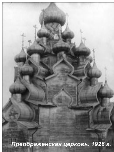
Преображенская церковь. 1926 г.

Аналогичное значение этого слова подтверждается и другим "Словарем русского языка. XI — XVII веков.": "Обложил", "обложили", "наложить", "покрыть чем-либо сверху, вокруг, обвязать", "одеть", "облечь", "украсить чем-либо", термин также подтверждающий факт освящения алтаря уже построенной церкви.