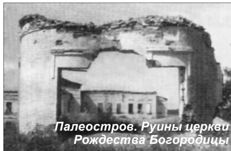
Палеостров. Руины церкви Рождества Богородицы

Родился Зосима в небогатой крестьянской семье в деревне Загубье Толвуйского погоста.