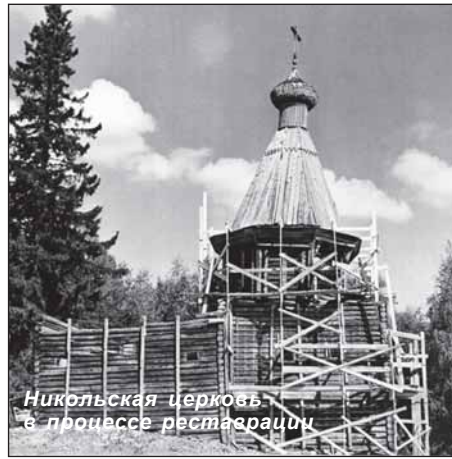
Никольская церковь в процессе реставрации

Работа на объекте шла своим чередом, и в субботний вечер по приглашению местного лесника мы посетили деревню Ушково, в которой в единственном обитаемом доме жили его родители.