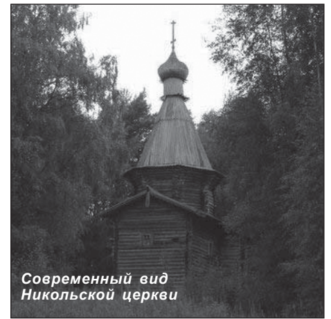
Современный вид Никольской церкви

Утренний поезд «Арктика» мы проспали, и выезжать из Беломорска пришлось разными поездами.