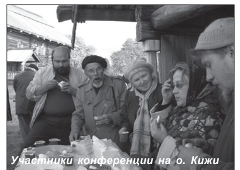
Участники конференции на о. Кижь