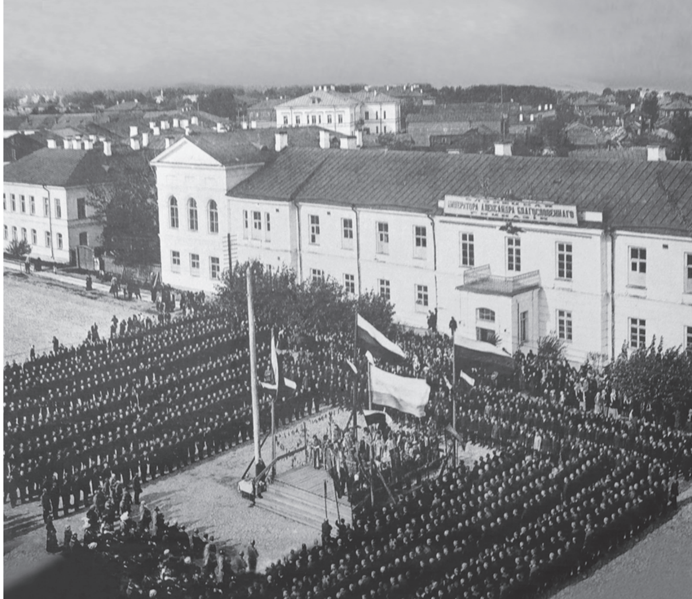
Проводы новобранцев на фронт, 1914 г.

Выставка работает до 28 сентября по адресу: ул. Федосовой, 19.