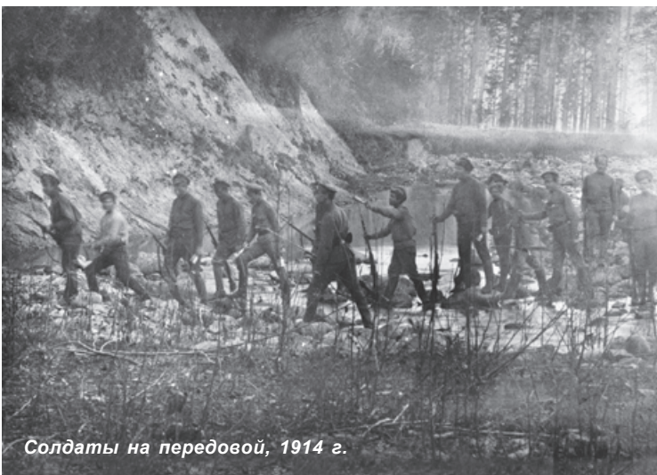
Солдаты на передовой, 1914 г.