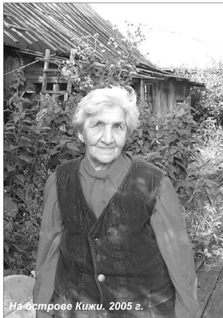
На острове Кижь. 2005 г.

Перед едой в армии давали хвойный отвар от цинги в железной кружке. Противно было, но не выльешь – не дадут в твой котелок еды. Солдатам давали в паек овес зерном или муку, которую они размешивали со снегом. Лошадь упавшую как-то солдаты зарезали, она орет, а мы живое мясо едим. Одного солдата расстреляли за портянки: ноги у него болели, украл портянки у командира. Командир всех выстроил и перед строем солдата расстрелял.