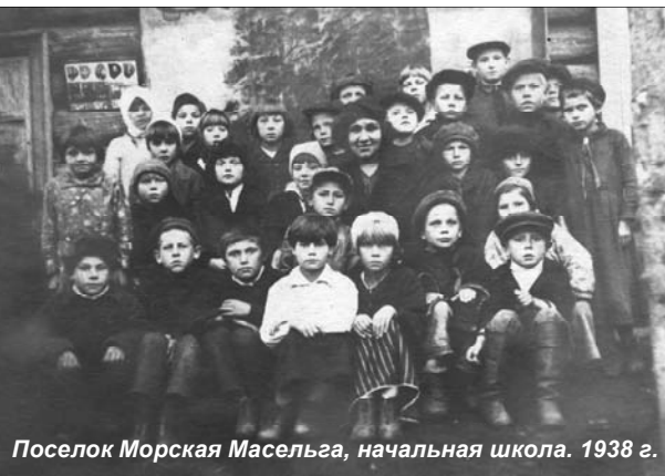
Поселок Морская Масельга, начальная школа. 1938 г.