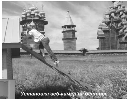
Установка веб-камер на острове