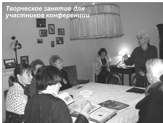
Теоретическое занятие для участников конференции

С 19 по 23 сентября в г. Санкт-Петербурге проходил Первый Всероссийский фестиваль детских музейных программ «Детские дни в Петербурге». 19 крупнейших музеев города принимали по специальным программам детей, их родителей и учителей. В это же время в город на Неве съехались около 200 специалистов из более чем 60-ти российских музеев. География обширнейшая – от Калининграда до Находки.