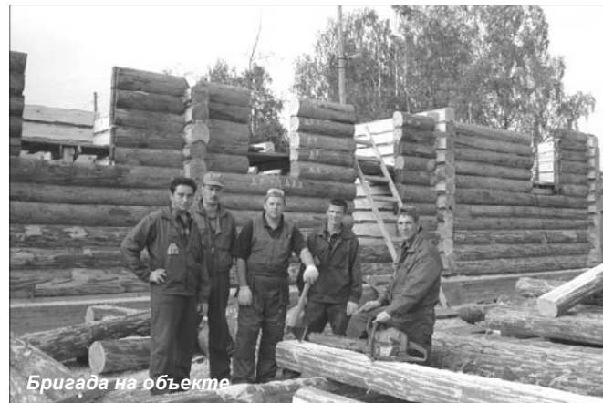
Бригада на объекте

ми производственными подходами, связанными со строгим соблюдением методологии и приемами реставрации. Нам импонирует отношение музея как заказчика. Организация конкурсов и заказов проводится очень четко, с конкретными инструкциями и пожеланиями.