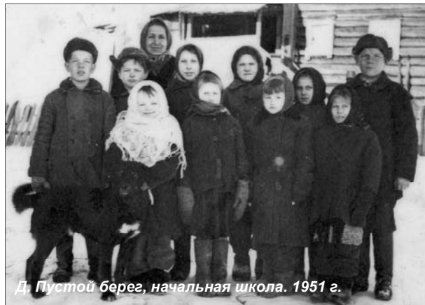
Д. Пустой берег, начальная школа. 1951 г.