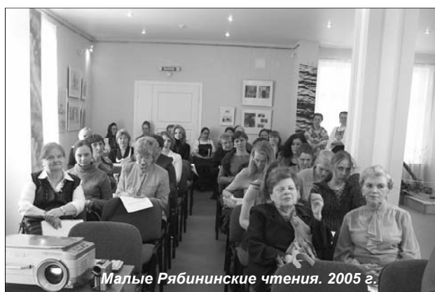
Малые Рябинские чтения. 2005 г.