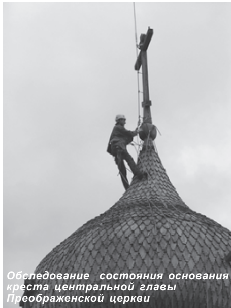
Обследование состояния основания креста центральной главы Преображенской церкви