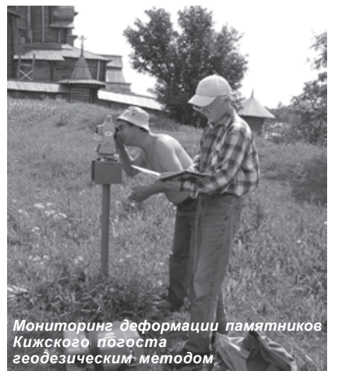
Мониторинг деформации памятников Кижского погоста геодезическим методом