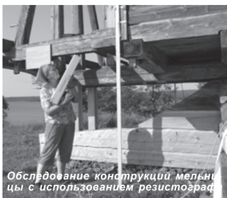
Обследование конструкций мельницы с использованием резистографа