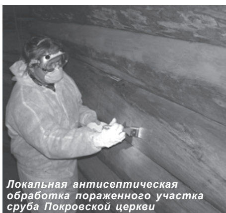
Локальная антисептическая обработка пораженного участка сруба Pokrovskaya церкви