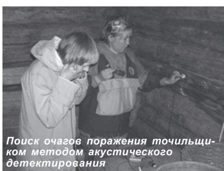
Поиск очагов поражения точильщиком методом акустического детектирования