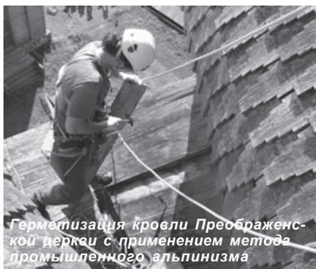
Герметизация кровли Преображенской церкви с применением метода промышленного альпинизма