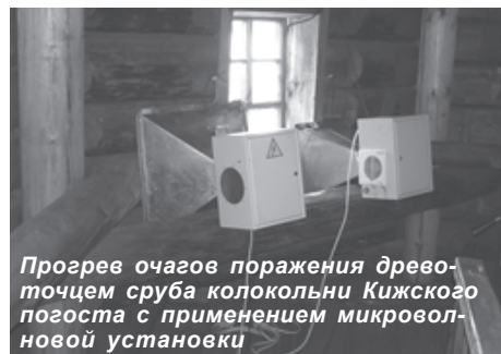
Прогрев очагов поражения древоточцем сруба колокольни Кижского погоста с применением микроволновой установки