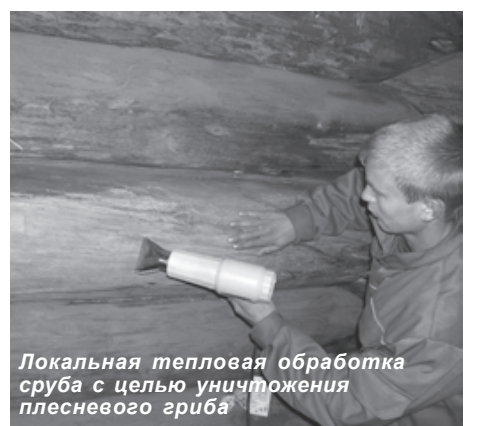
Локальная тепловая обработка сруба с целью уничтожения плесневого гриба