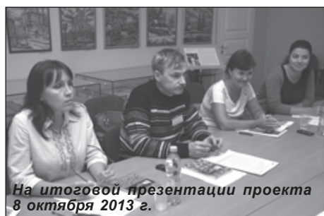
На итоговой презентации проекта 8 октября 2013 г.

Большая часть времени в ходе реализации проекта была потрачена на обоюдное знакомство. Оказалось, что в окрестностях острова уже работает большое количество гостевых домов. С каждым годом появляются новые. Кажется, что эта сфера туризма постепенно начинает развиваться в окрестностях острова Кижь. Но пока что это разрозненная деятельность. Впервые руководители гостевых домов встретились вместе на День Кижской волости на острове, где был презентован сборник с путевой информацией «Сокровища Кижских шхер».