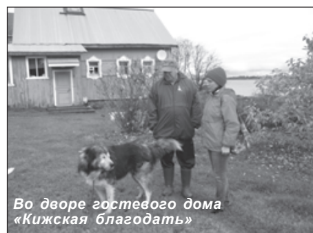
Во дворе гостевого дома «Кижская благодать»