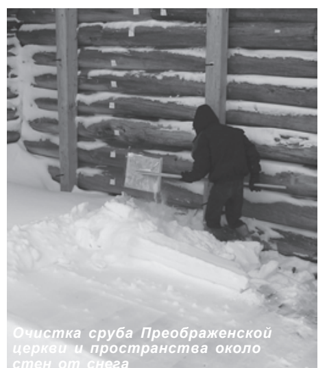
Очистка сруба Преображенской церкви и пространства около стен от снега