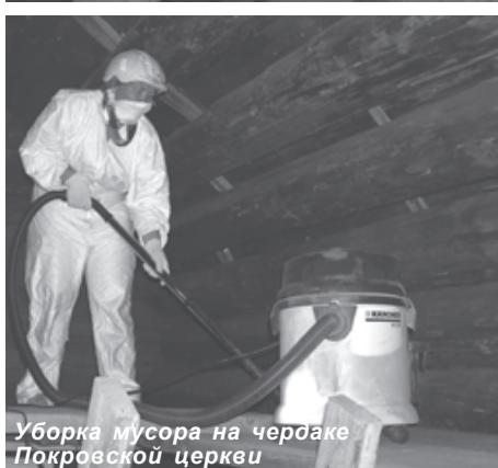
Уборка мусора на чердаке Pokrovskaya церкви

Памятник, пришедший в аварийное состояние, реставрируют — об этом знают все. Но не все понимают, что правильнее создать для исторической постройки условия, при которых она никогда не достигнет такого состояния. «Реставрация должна быть исключительной мерой», — гласит Венецианская хартия.