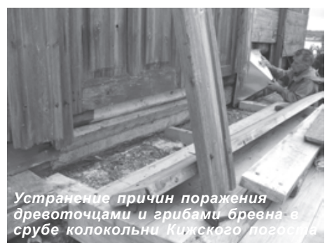
Устранение причин поражения древоточцами и грибами бревна в срубе колокольни Кижского погоста