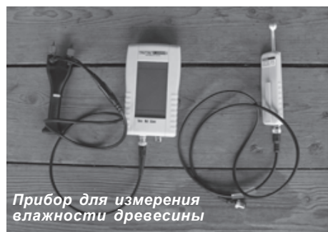
Прибор для измерения влажности древесины