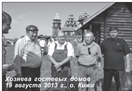
Хозяева гостевых домов 19 августа 2013 г., о. Кижь

Оказалось также, что у руководителей гостевых домов зачастую весьма отдалённое представление о деятельности музея, о его возможностях, о тех услугах, которые может предоставить музей. А ведь без музея, без памятников архитектуры, которые реставрирует и сохраняет музей, туристический бизнес в этом отдалённом районе был бы практически невозможен.