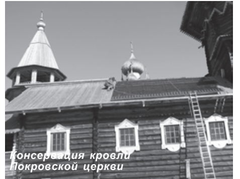
Консервация кровли Pokrovskaya церкви